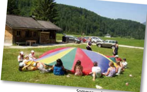
Sommerwoche 2010 in Grünau