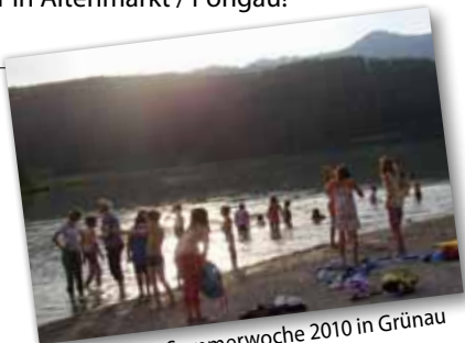
Sommerwoche 2010 in Grünau