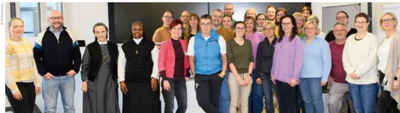
Die erste Ausbildung von 25 Peers startete im Dezember 2025, weitere folgen 2026. Langfristig steht Peer Support allen Berufsgruppen offen. Ein starkes Zeichen für gelebte Kollegialität - und dafür, dass niemand allein bleiben muss, wenn es schwierig wird.

Halt und helfen, das Erlebte einzuordnen. Schnell, vertraulich und auf Augenhöhe. Dabei geht es nicht um Therapie, sondern um Entlastung, Zuhören und erste Hilfe für die Seele - oft schon kurz nach dem Ereignis, noch bevor der Dienst endet. Ziel ist es, Stress zu reduzieren, die psychische Gesundheit zu stärken und den Zusammenhalt im Team zu fördern. ■