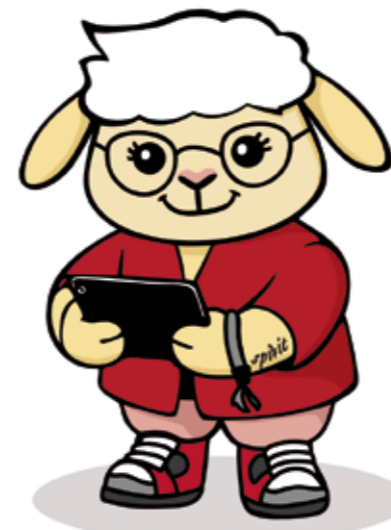
FRANCY verbindet, informiert und erleichtert den Arbeitsalltag.

■ Ziel war es, eine App zu entwickeln, die den Arbeitsalltag spürbar erleichtert und allen Mitarbeitenden einen einfachen Zugang zu wichtigen Informationen bietet: Ab sofort finden sie viele Neuigkeiten und Inhalte aus dem Unternehmen direkt auf ihrem Smartphone. Ob aktuelle Infos, relevante Termine oder der schnelle Kontakt zu Kolleg:innen - FRANCY bündelt alles an einem Ort. Auch Job-Angebote können unkompliziert mit Freund:innen und Bekannten geteilt werden. ■